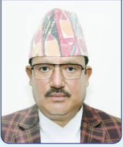
निर्वाचन आयुक्त रामप्रसाद भण्डारी