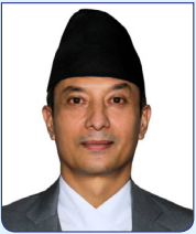
निर्वाचन आयुक्त सगुन शम्सेर ज. ब. रा.