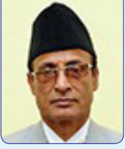
निर्वाचन आयुक्त इश्वरीप्रसाद पौड्याल